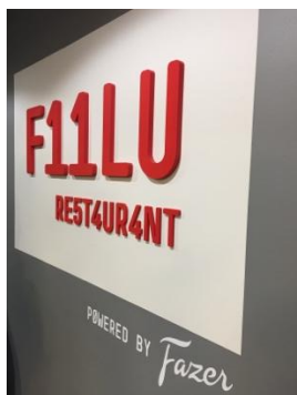
← Ravintola Fiilu

在 Matkakeskus(火車站)附近有一家算是公司的餐廳叫做 Ravintola Fiilu，平日下午兩點半以後會開放給學生以學生價 2.6 歐吃午餐，要記得帶學生證，跟學校的學餐一樣價錢，多了咖啡可以喝喔！