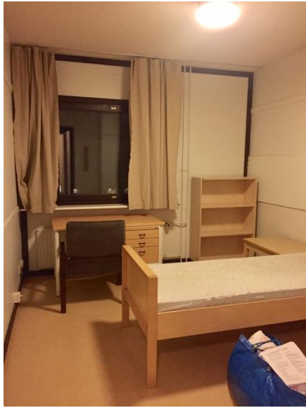
←KOAS 的個人房 (ps, 帶個室內拖會比較方便)