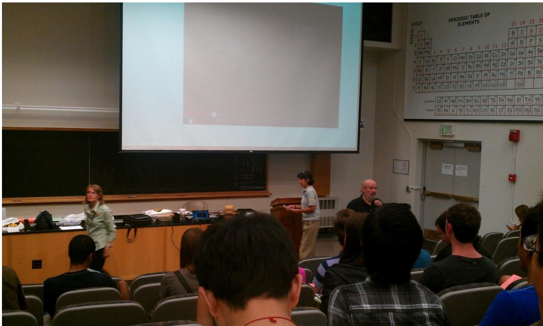
國際學生新生訓練